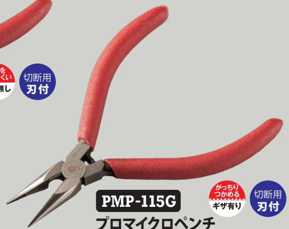
PMP-115G プロマイクロペンチ