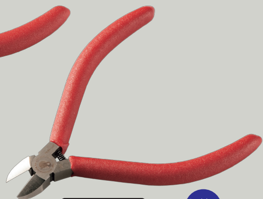
PMN-115G プロマイクロニッパ