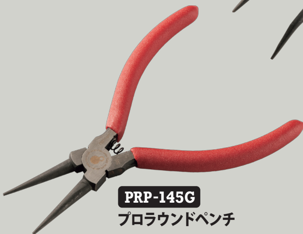
PRP-145G プロラウンドペンチ