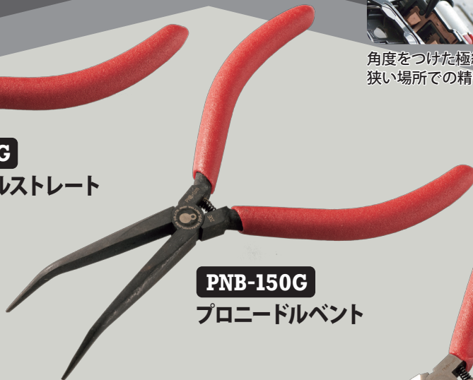
PNB-150G プロニードルベント