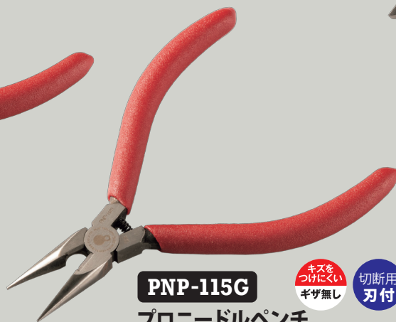
PNP-115G プロニードルペンチ