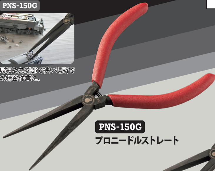
PNS-150G プロニードルストレート